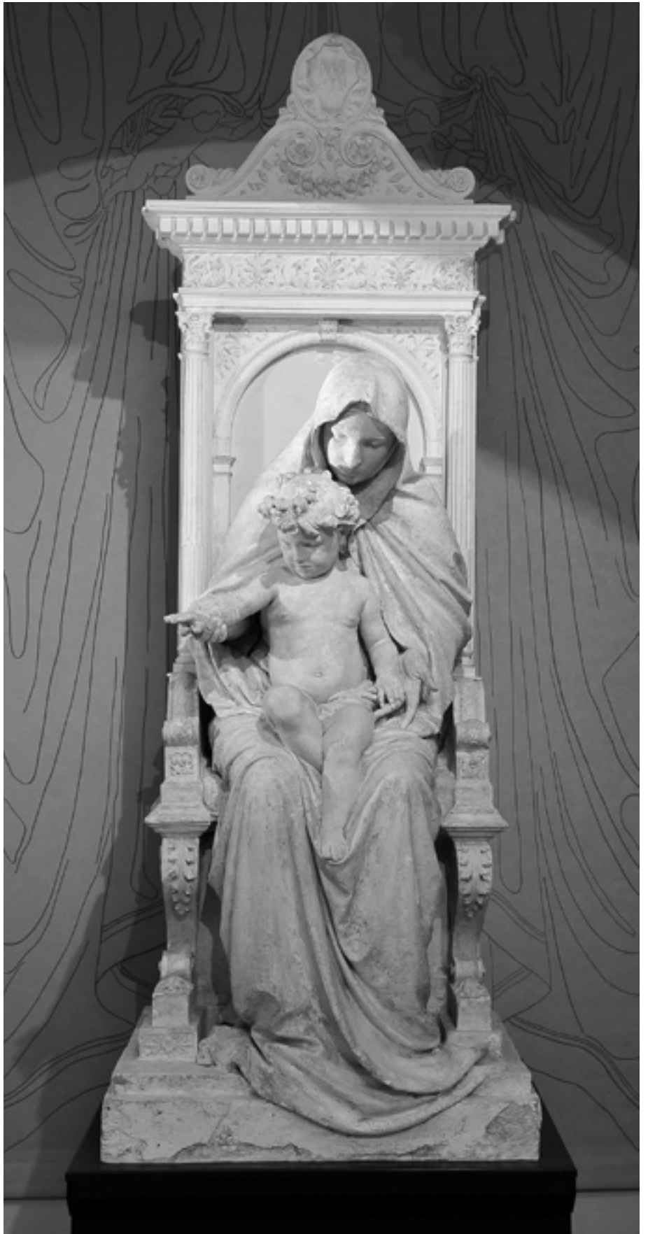
6 Bozzetto Madonna con bambino [Esboço Nossa Senhora com menino], 1887