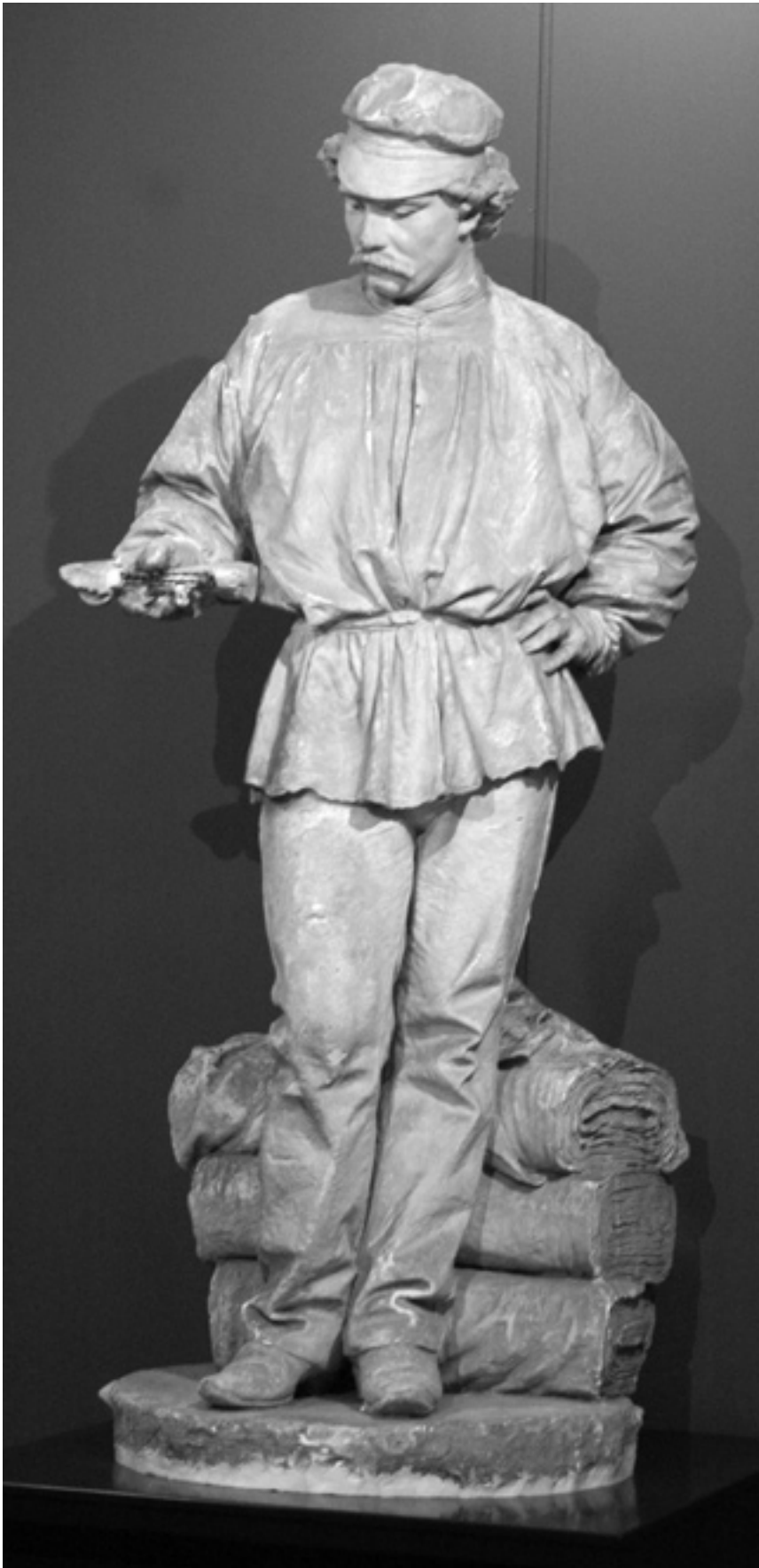
5 Tessitore [Tecelão], 1878